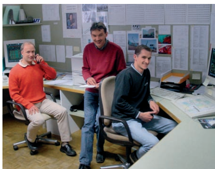
Le bureau de construction , le cœur et le moteur pour le développement au service du client