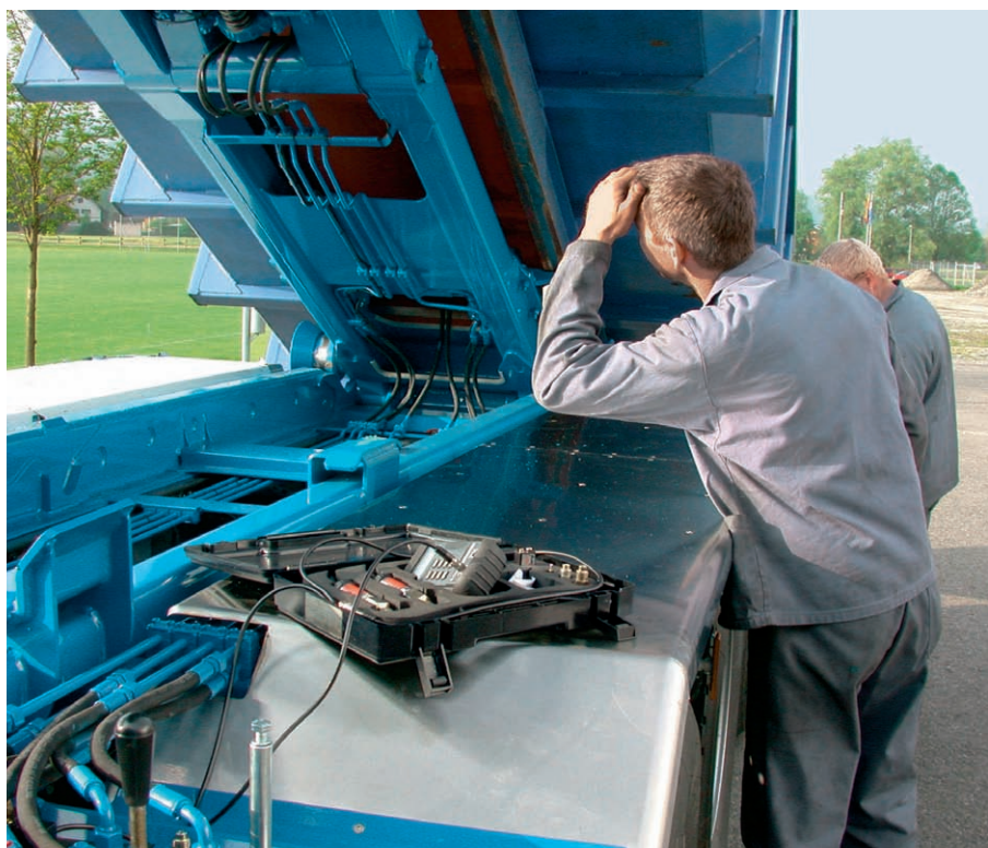
Vérification fonctionnelle avant la livraison