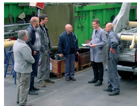
Le montage , les derniers souhaits du client sont réalisés lors du montage, suite à sa visite