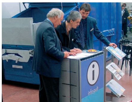
Le conseil à la clientèle , la base de toutes nos activités