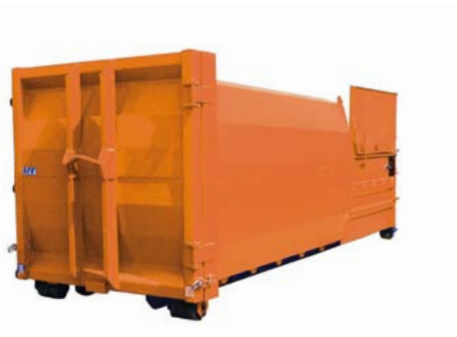
PC 600 AR für Abrollkipper