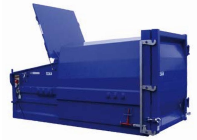
PC 600 AK für Absetzkipper